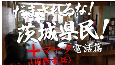
【動画その2イメージ】